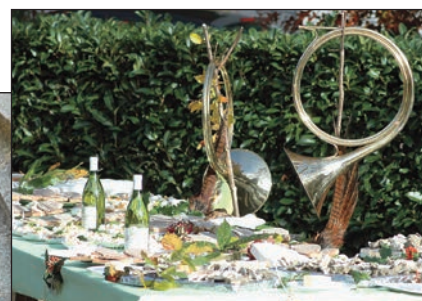
Sortie de la messe de la Saint-Hubert